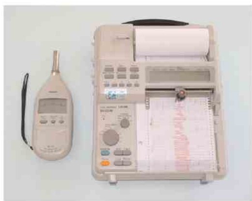
(a) 普通騒音計とレベルレコーダ