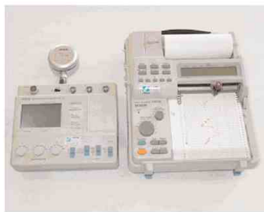
(b) 振動レベル計とレベルレコーダ