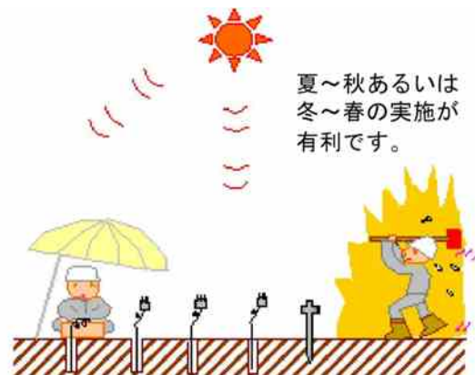
図-3 1m 深地温探査の実施概念図